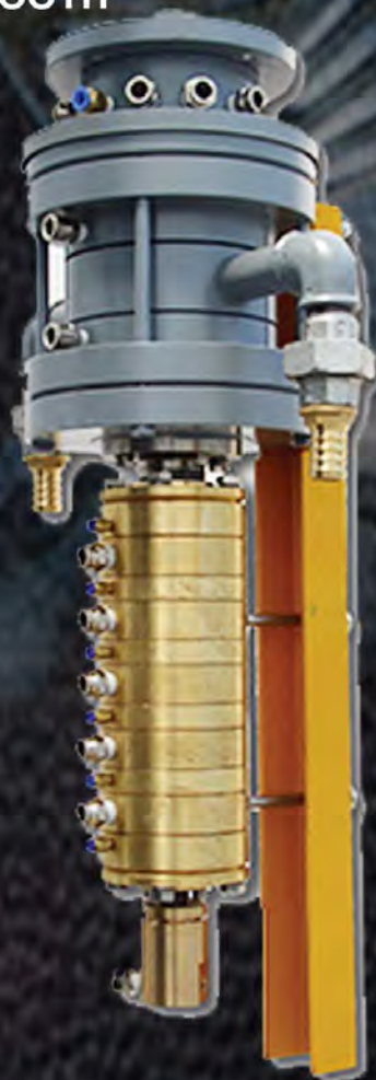
AD 36 AP

EL.PA Service S.r.l. Tannery Engineering Viale Europa 91/F - 36075 Montecchio Maggiore ( Vi ) - Italy