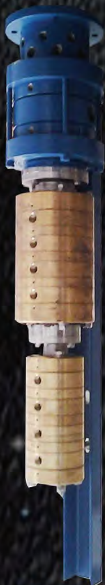
AD 39 AP

A COMPLETE SET FROM 6 TO 16 PRODUCT WAYS THE BEST SOLUTION FOR YOUR SPRAY BOOTH